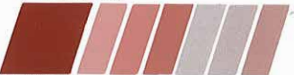
ROJO ÓXIDO 320944