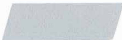
ALUMINIO MEDIANO DESTELLANTE 320903