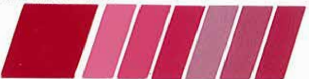
ROJO TRANSPARENTE 320912