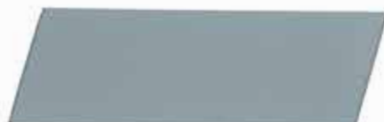
PRIMER R1 GRIS MEDIO 320951