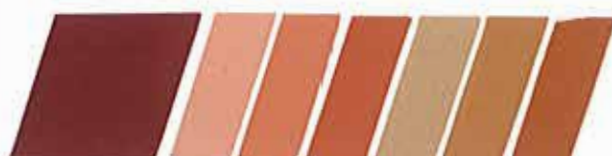
ORO ROJIZO 320923

Tono Lleno Dilución Blanco Dilución Aluminio