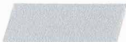
ALUMINIO EXTRA GRUESO 320910