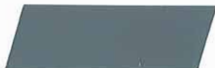
PRIMER R1 GRIS OSCURO 320952