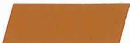
ALUMINIO BRONCE 320933