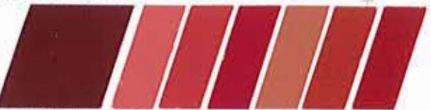
ROJO PERRINDO 320932