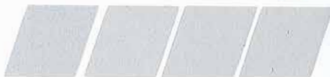
BLANCO TRANSPARENTE 320914