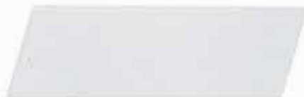
PRIMER R1 GRIS CLARO 320950