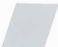
FLEXPRIMER PLUS GRIS CLARO 320947