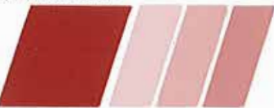
ROJO ÓXIDO BC 320945