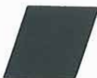
FLEXPRIMER PLUS NEGRO 320948