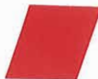
FLEXPRIMER PLUS ROJO BERMELLÓN 320946