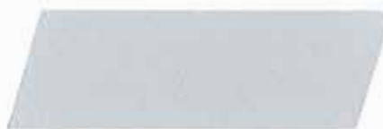
ALUMINIO FINO DESTELLANTE 320916