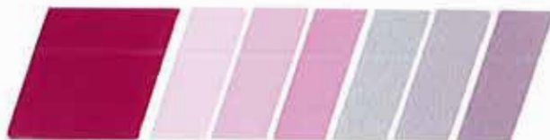
MAGENTA MORADO CLARO 320935