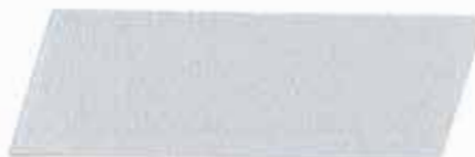
ALUMINIO MEDIANO 320901