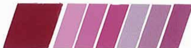
MAGENTA MORADO 320924