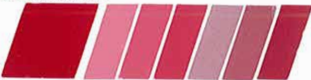
ROJO MONASTRAL 320939