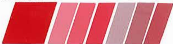
ROJO CLARO 320908