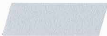
ALUMINIO GRUESO 320906