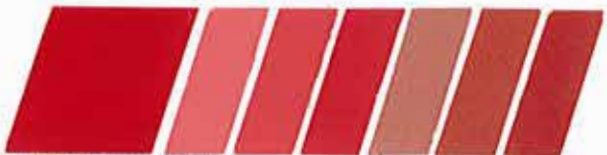
ROJO ESCARLATA 320915